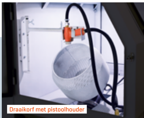
Draaikorf met pistoolhouder