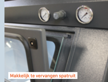
Makkelijk te vervangen spatruit