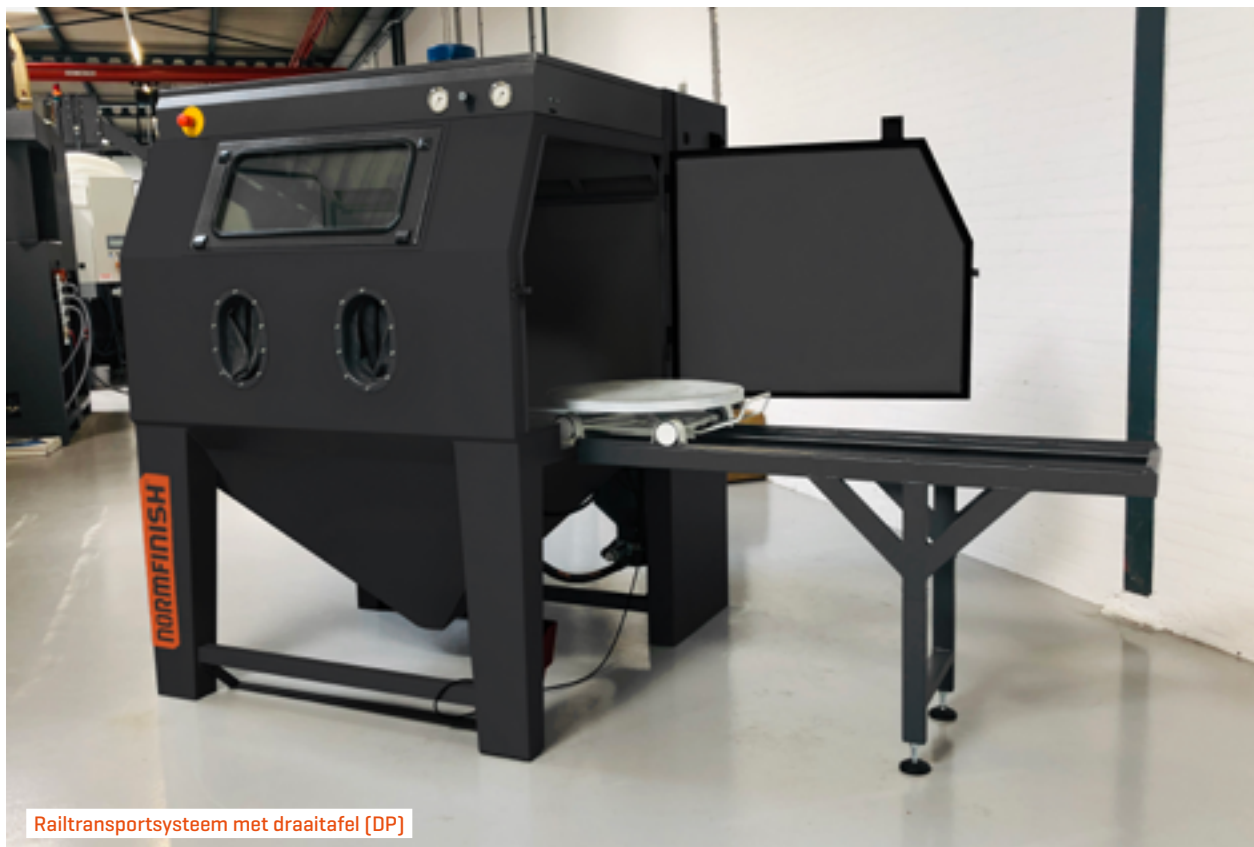
Railtransportsysteem met draaitafel (DP)