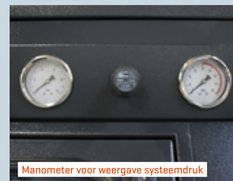
Manometer voor weergave systeemdruk